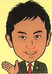
三鷹会場①② 八王子会場講師